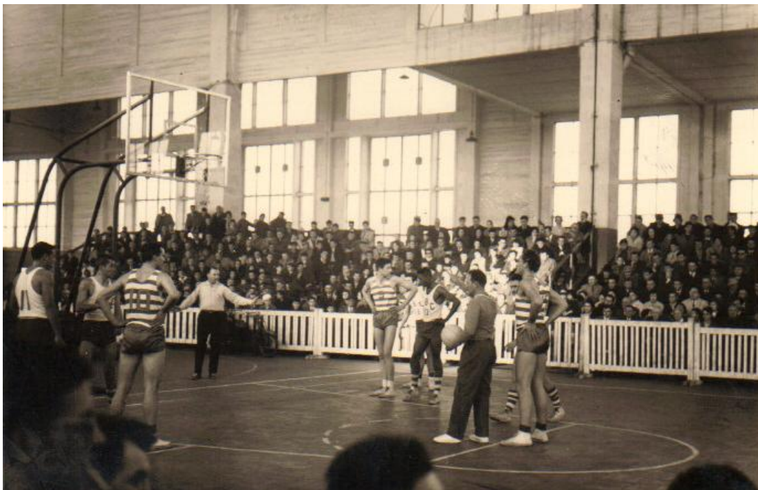
Photo non datée opposant l'ABC à L'Alsace de Bagnolet